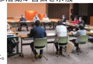
花火師を交えた実行委員会での話し合い

振り返れば、コロナ禍で、さまざまな活動が自粛を余儀なくされ、つながりが途切れそうになりました。つながりをゼロにしたい思いはたくさんの方々へ伝わり、次々とつながりが息を吹き返し、広がりました。