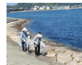
翌日の海岸清掃。最後までありがとうございました。