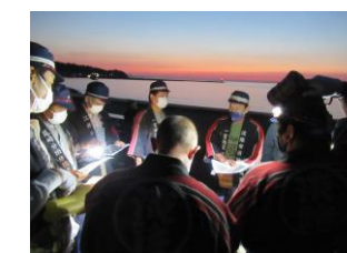
安全確保のため、事前の警備打ち合わせ