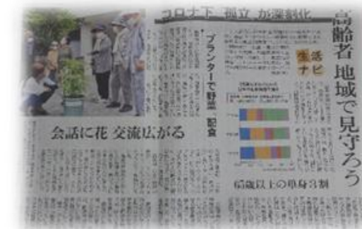
7月14日の日本農業新聞

掲載された新聞を届けに行くと、大変喜んでいただき、さっそくみんなに配ってくださるとのことでした。