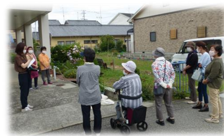
記者（左）から取材を受ける第11老人クラブのみなさん

淡路市社協では、コロナ禍で人と会う機会の減少や、外出自粛等により地域の中での孤立化を防ぐと昨年に引き続き今年もプランターファーム見守りプロジェクトを実施しています。東浦地区では16グループ240名がこのプロジェクトに取り組んでいます。