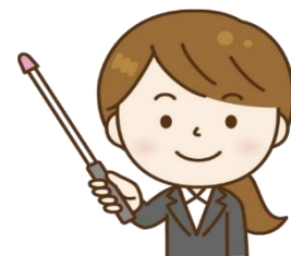
講座マスコットキャラクター みほちゃん