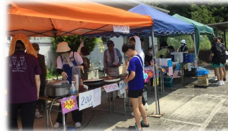
8月6日 竹の子作業所

長期の休みなどで、親御さんが仕事で日中いない場合の過ごし方の現況や課題などについても意見を出し合いました。また各々がもっているノウハウを生かしながら、今まで行ってきた「志筑みんなで楽しもうイベント」に加え、シリーズで「竹の子&幸来カフェ」、また今年新たに関西看護医療大学も地域の方に大学