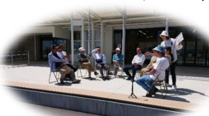
佐野のいいところ…座談会♪