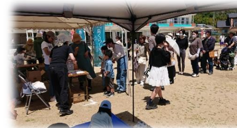
イベントのようす

5月5日、「佐野地域まちづくり推進協議会」と「佐野和太鼓クラブ」、「NPO 法人島暮らし淡路」が主催で、こども日イベント in さのが、初めてさの小テラスで行われました。当日は、佐野和太鼓クラブによる演奏や和太鼓の体験会、佐野地域の方と移住者の座談会、フリーマーケット、防災体験等があり、200名を超える来場者がありました。初めてのイベントで、地域でも新たなつながりの機会となりました。