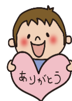
協力いただいたこども服