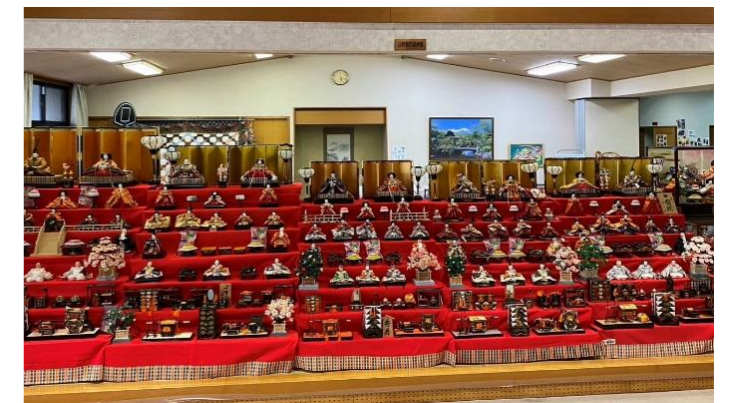
ゆうゆうライフで3月中飾っています。お立ち寄りください。

私は、新しい生活様式や活動や慣習の再開が、私たちに大きな力を与え、失われた活動を回復させる芽吹きのように感じています。(だいどう)