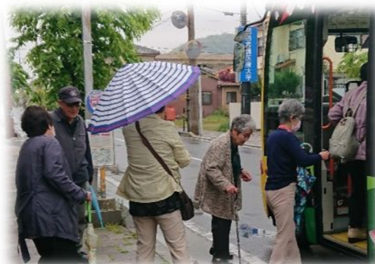
これから出発です!!