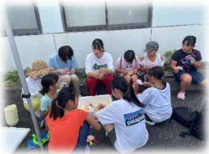
大人気なメダカすくい