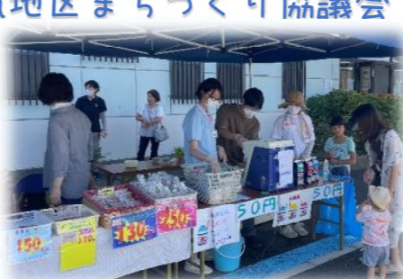
かき氷♪何味にしようかな?