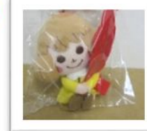
あかはねちゃんストラップ