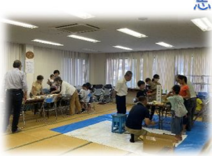
竹鉄砲づくりと フリスビーづくりに夢中