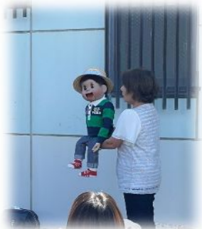
腹話術の披露もあり

8月25日の金曜日、昨年に引き続き、志筑まちづくり協議会と社協つなの共催で「みんなで楽しもうイベント」を志筑公民館で行いました。