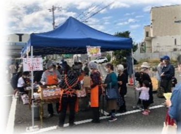
令和4年度のまつり様子