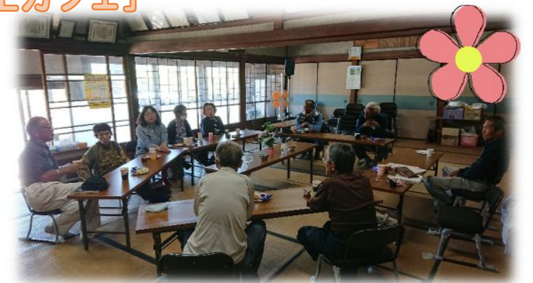
10月のカフェの様子

今回は久しぶりに参加した人もおられ、「また寄らんかよ～」と声をかけあっていました。ゆるやかな、ほっとできる時間が流れる居場所となっているように