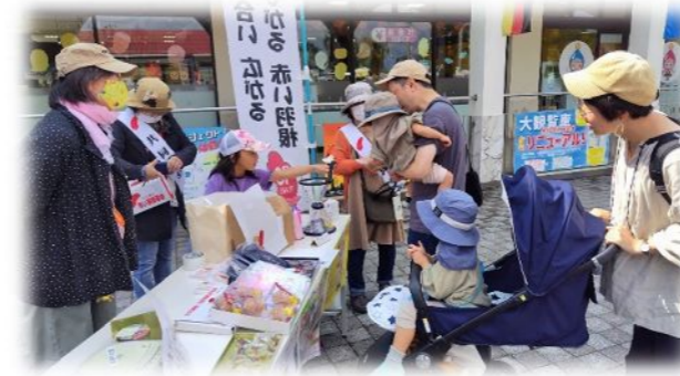
子ども達からの募金(ONOKOROにて)

地域支えあいセンターつなでも、10月15日(日)に淡路ワールドパーク ONOKOROにて、地域支えあいセンターつなの運営委員と街頭募金を行いました。家族連れが多く来場されており、子ども達が、コインが回るぐるぐる募金箱に入れてくれるなど親子で楽しく募金していただきました。