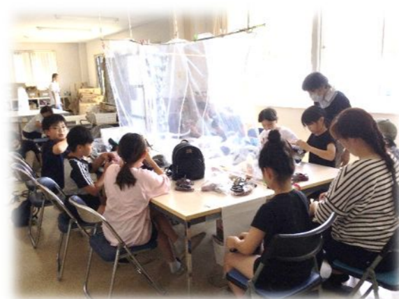
マット編みに集中!!

今後も住民の方とふれあう機会を多く持ち、地域の身近な場所となるように活動していきます。