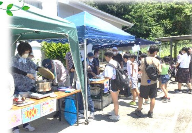
手作りカレーやかき氷、作業所製品販売でにぎわいました

夏休みだったので、近く子ども達や部活帰りの高校生、トライやるウィークで来てくれていた中学生等地域の方がたくさん来てくれました。